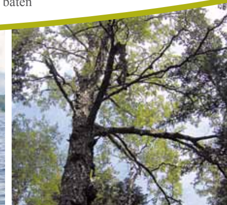
Den lummiga skogen