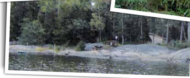
Rastplatsen där du kan lägga till båten