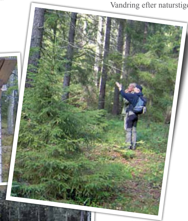
Vandring efter naturstigen